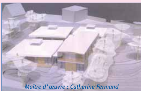
Maître d'œuvre : Catherine Fermand

3 logements seront construits, attenant à la Crèche, dont la livraison est prévue pour le 1 er trimestre 2007.