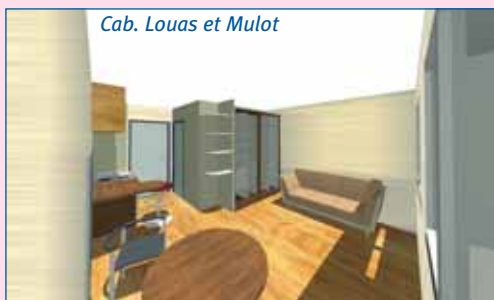
Cab. Louas et Mulot

Au n°18 du boulevard St Antoine, 36 logements pour élèves infirmières vont être réorganisés en studios ; la livraison des studios est envisagée pour juin 2007.