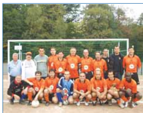
■ L'équipe Vétérans du Muppets

De nombreux locataires ou ex-locataires de VH, amateurs de foot-ball, jouent dans ce club en championnat et en PH (équipe des 18-35 ans). Pourquoi pas vous ?